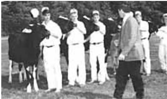
Abb. 4: Aufstellen in der Endlinie: Freie Sicht für den Richter

und bei Bedarf das eigene Tier in der bestmöglichen Position zeigen. Steht das Tier in idealer Haltung ist es wichtig dem/der PreisrichterIn freie Sicht auf das Tier zu gewähren (siehe Abb. 4 und 5).