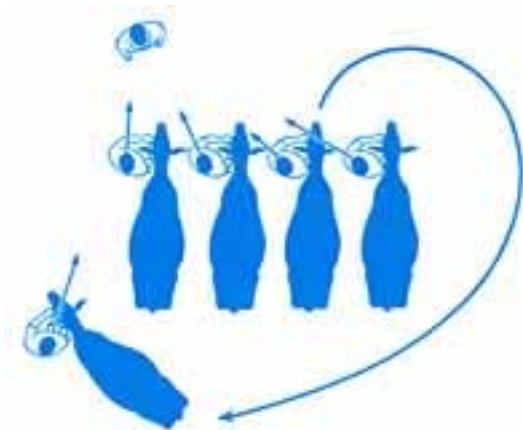
Abb. 5: Aufstellen in der Endlinie: Aufmerksamkeit gegenüber dem/der RichterIn

Die Abbildungen 4 und 5 zeigen deutlich, daß die VorführerInnen sich in der Endlinie immer zum Preisrichter drehen, um jedes Signal von ihm sofort erkennen zu können. Die Position in der Endlinie sollte nur nach Anweisung durch den/die RichterIn oder Ringassistent(en)In geändert werden. Kommt es zu solch einer Änderung der Reihenfolge, ist diese zügig auszuführen. Zudem sollte der Bogen ausreichend groß gegangen werden, um gerade in die Endlinie wieder hineinziehen zu können.