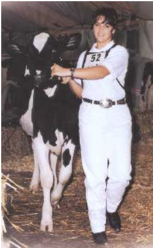
Abb. 1: Richtige Vorführhaltung beim Einzug in den Ring

Der Einzug in den Ring erfolgt zügig . Erst wenn der Ring betreten wird, darf das langsame Vorführtempo gezeigt werden. Der/Die VorführerIn zieht vorwärts in den Ring hinein (siehe Abb. 1).