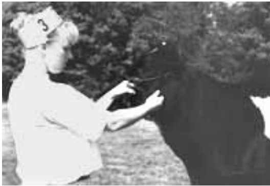
Abb. 2: Korrekte Vorführhaltung

der linken oder in der rechten Hand gehalten. Wichtig ist, daß der/die VorführerIn mit der rechten Hand nötige Korrekturen am Tier verrichten kann – die rechte Hand ist immer am Tier (Halsfalte, Schulter oder Herzbereich; sieht Abb. 2).